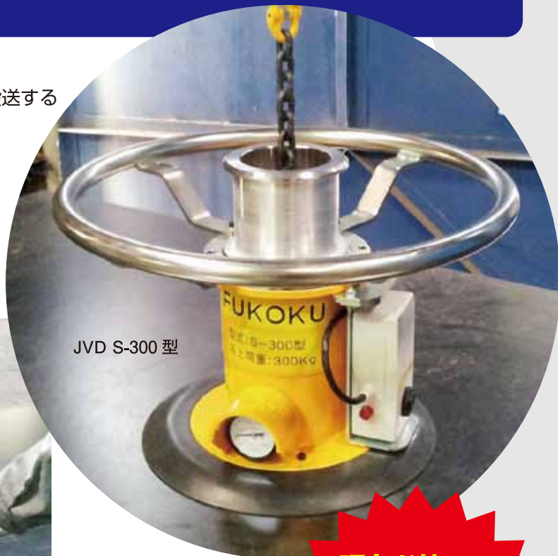
JVD S-300 型

エア漏れ検知・警報装置は、ドイツの安全規格に準じて製作されており、高い信頼性を誇ります。